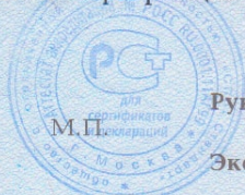
Схема сертификации: 2.