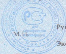
Схема сертификации: 2.